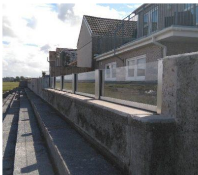
Slika: Primer steklenih elementov v visokovodnem zidu.

Na odsekih, kjer je zid visok, je mimo objektov predvidena v zgornjem delu steklena stena (nad višino zidu 1,50 m) – steklena zaščitna pregrada po sistemi kot. npr. IBS Technics. Zaščita se postavlja v vnaprej pripravljene odprtine AB zidu. Material zapornih elementov je večplastno lepljeno steklo, skupne debeline min. 55 mm. V utore se namesti vertikalna in horizontalna tesnila (EPDM). Pritrdilni elementi so iz nerjavnega jekla V4A. Pritrdilne plošče vmesnih stebrov so iz nerjavnega jekla SS 304, vmesni stebri pa iz aluminija EN AW-5053-T6.